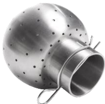
Option Boule de lavage et pompe